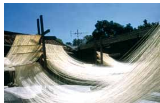
Método tradicional de secado al sol de fideos.