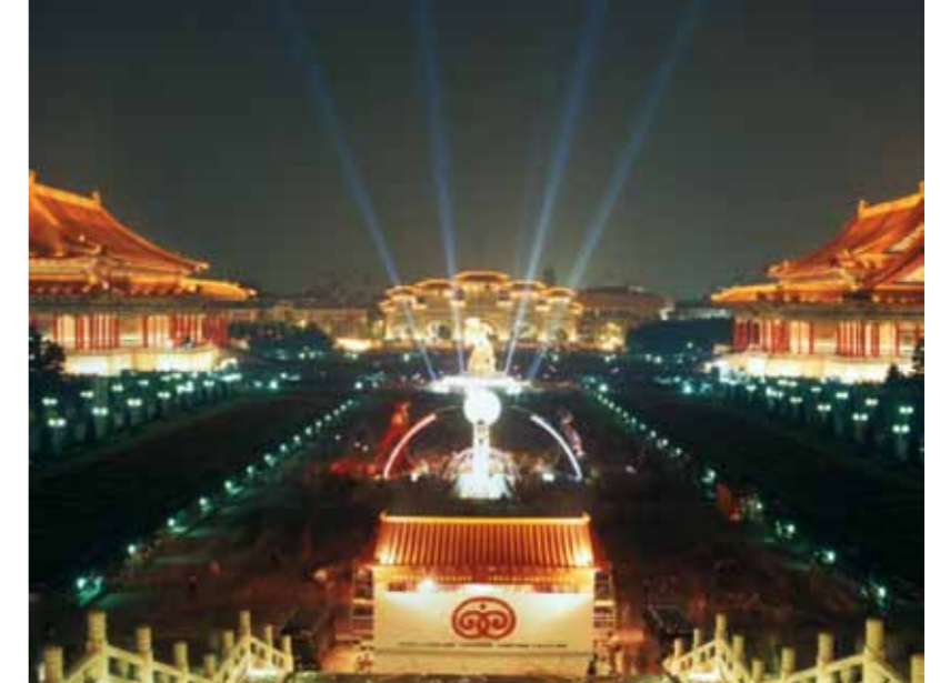
El Festival de los Faroles es una de las fiestas más espectaculares de Taiwán.