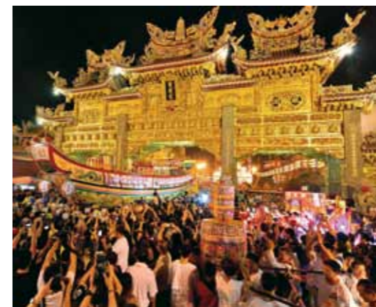
Ritual religioso a las puertas del templo.