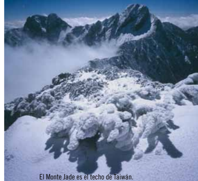
El Monte Jade es el techo de Taiwán.