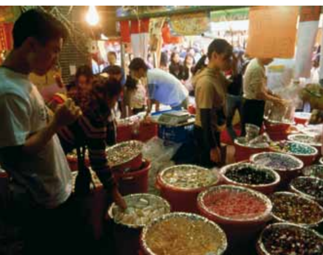
Mercado de comida en la calle Dihua, Taipei.