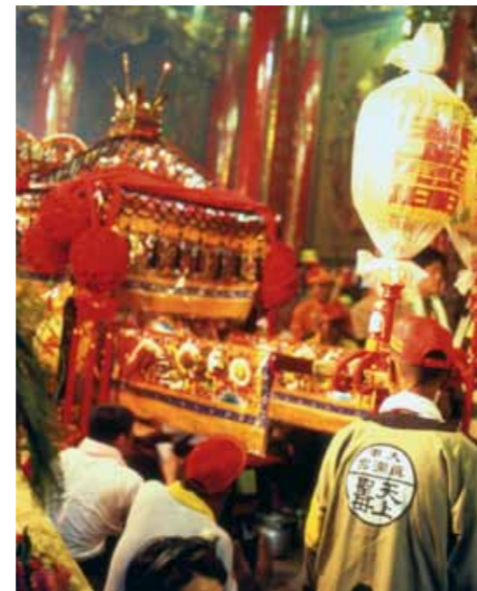
Peregrinación por la Diosa Matsu.

Ello revela que bajo el estrato más reconocible de esta singular urbe, cuyos máximos exponentes bien pudieran ser el citado museo, el rascacielos Taipei 101 o el Monumento a Chiang Kai-shek, hay una ciudad en continua ebullición con un corazón latiendo en cada calle, en cada parque y, sobre todo, en cada uno de los muchos mercados nocturnos que dan color, olor y sabor a esa otra Taipei deseosa de ser descubierta por el viajero.