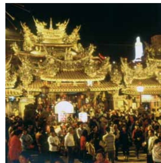
Templo Chaotien en Beigang.