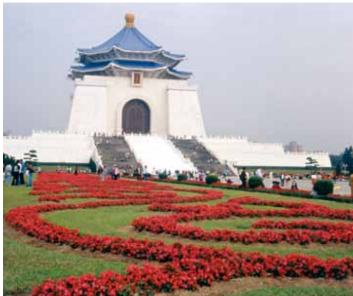
Monumento a Chiang Kai-shek, en Taipei.