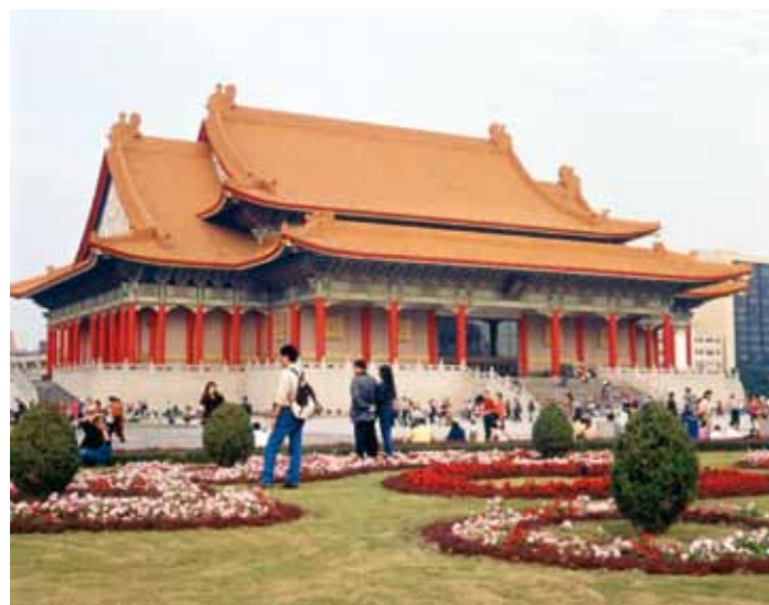
Sala de Conciertos, Taipei.