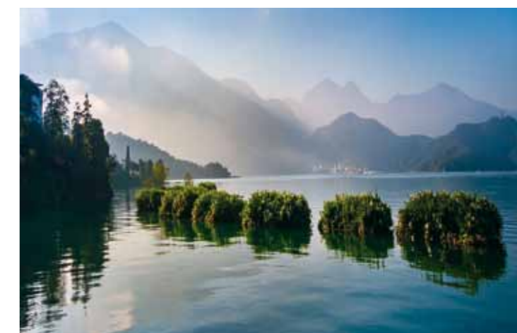
Lago del Sol y de la Luna.