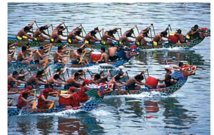
Festival de los Botes Dragón.

Las tradiciones del Año Nuevo Lunar, el Festival de los Faroles, el Festival de los Botes Dragón, los rituales del Mes de las Ánimas, las celebraciones por las buenas cosechas propias de las tribus aborígenes o el culto religioso en los templos combinan tradición, religiosidad, colorido y espectacularidad a partes iguales y son disfrutados y admirados por igual por locales y foráneos.