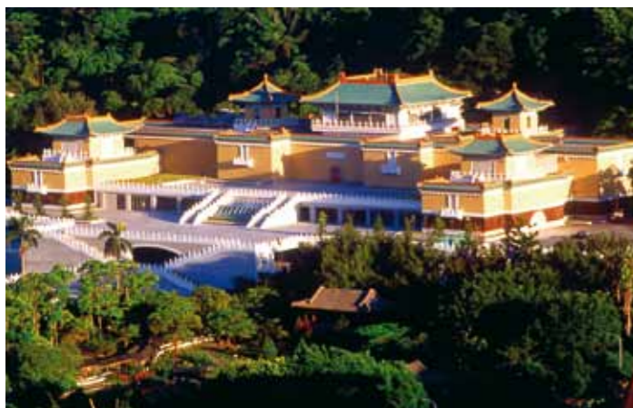
Museo Nacional del Palacio.