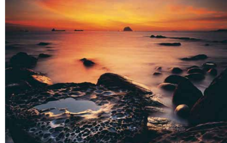
Atardecer en la costa nororiental de Taiwán.