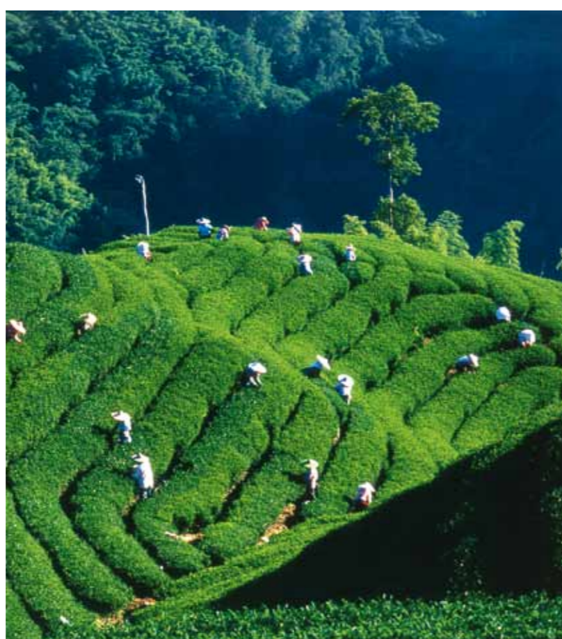
Campos de cultivo de té.